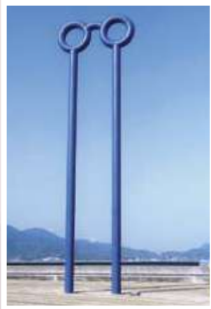
8 松永 真 / Shin MATSUNAGA 千里眼“のぞいてみよう、 瀬戸田から世界が見える。” / Clairvoyance “Look through the glasses, you can see the world from Setoda” 炭素鋼鋼管(エポキシ塗装)、1500×451×46cm