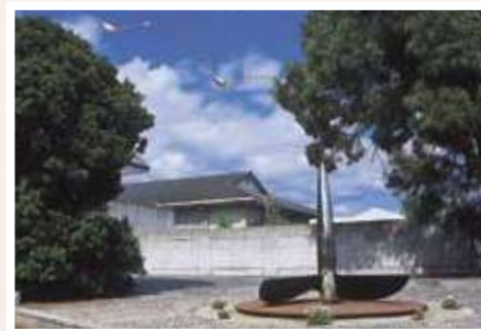
4 田中信太郎 / Shintaro TANAKA 一羽の鳥の為に / Only for One bird 鉄・ステンレス・ブロンズ、575×300×300cm