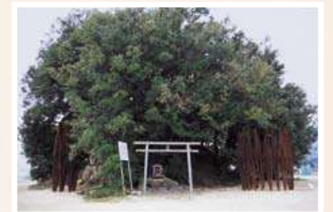
17 青木野枝 / Noe AOKI 塩池 / Salt Pond 鉄(耐候性鋼)、H:240cm Ø:230cm H:330cm Ø:130cm