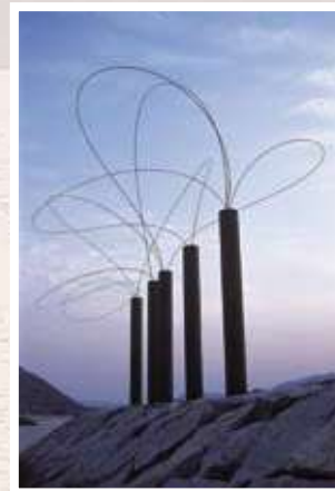
10 宮脇愛子 / Aiko MIYAWAKI うつろひ / Utsurohi ステンレスワイヤー、耐候性鋼管 600×1100×500cm