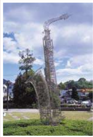
6 西野康造 / Kozo NISHINO 風の中で(瀬戸田) / It is Breezing (In SETODA) ステンレス、500×200×90cm