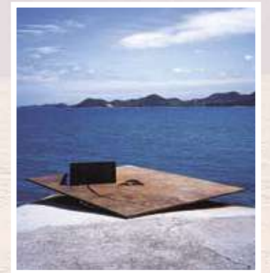
14 海老塚耕一 / Koichi EBIZUKA 空/海 YURAGI / SORA/UMI YURAGI 鉄、120×593×453cm