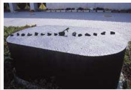
3 福岡道雄 / Michio FUKUOKA 飛石 / The Stepping Stones ブロンズ、78×183×110cm (瀬戸田小学校中庭に設置)