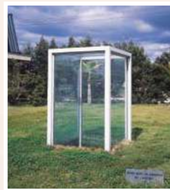
2 崔 在銀 / JAE-EUN CHOI 地上と地下の間で / Between Ground and Underground 土・ガラス・鉄、330×150×150cm