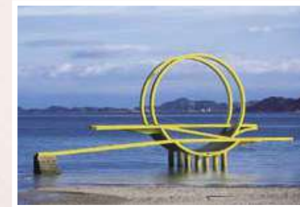
16 川上喜三郎 / Kisa KAWAKAMI ベルベデーレせとだ / Belvedere Setoda 鉄(ポリウレタン塗装)、850×1930×418cm