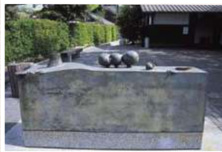
5 山本正道 / Masamichi YAMAMOTO 海からの贈物 / Gift from the Sea ブロンズ、83×196×51cm