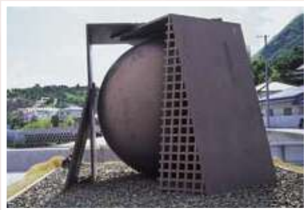
7 保田春彦 / Haruhiko YASUDA 球を包む幕舎 / Sphere Wrapped in Tabernaculum 鉄(ポリウレタン塗装)、218×320×275cm