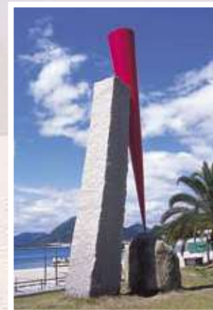
13 植松奎二 / Keiji UEMATSU 風のとき 赤いかたち/傾 / Calm Time-Red Form/Inclination 御影石・鉄(ポリウレタン塗装) 500×230×100cm