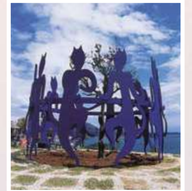
15 滑川公一 / Koichi NAMEKAWA CATS DANCE / Cats Dance 鉄(ポリウレタン塗装)、H:225cm Ø:300cm