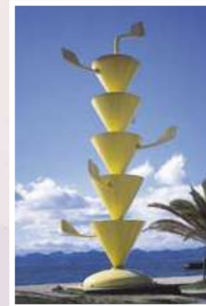
12 眞板雅文 / Masafumi MAITA 空へ / Come Into the Sky 鉄(ポリウレタン塗装)、1030×350×350cm