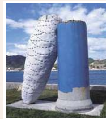
瀬戸田町合併40周年記念寄贈作品 1 岡本敦生 / Atsuo OKAMOTO 地殻 / Crust 白御影石、ヒューム管、セメント、他 290×250×130cm