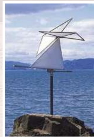
9 新宮 晋 / Susumu SHINGU 波の翼 / Wings of the Waves ステンレス・帆布、H:627cm Ø:490cm